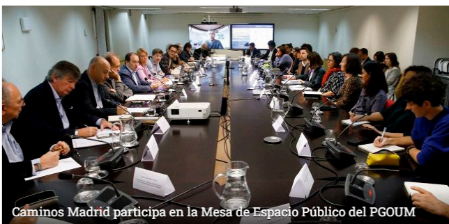
Caminos Madrid participa en la Mesa de Espacio Público del PGUUM