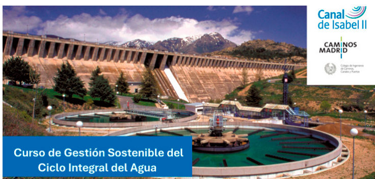
Curso de Gestión Sostenible del Ciclo Integral del Agua