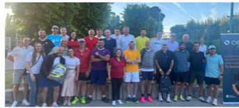
14 MAYO, 2024 91 FOTOS

Campeonato de Golf Santo Domingo de la Calzada 2024