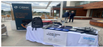
21 MAYO, 2024 35 FOTOS

Campeonato de Golf Santo Domingo de la Calzada 2024