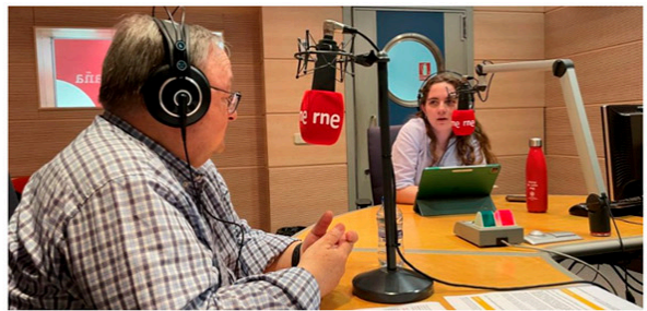
A golpe de bit con el Colegio de ingenieros de Caminos, Canales y Puertos de Madrid (29/05/2024)

Torneo Pádel - Tenis Santo Domingo de la Calzada 2024