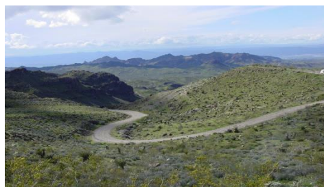
Tramo de la antigua US 66 todavía en servicio

La Ruta 66 fue el principal itinerario de los emigrantes que iban al oeste, especialmente durante las tormentas de polvo de los años 30 y sostuvo la economía de las zonas que la carretera atravesaba. La gente que prosperó durante la creciente popularidad de la carretera fue la misma que años más tarde luchó por mantenerla viva cuando, durante la presidencia del general Eisenhower, empezó a construirse la nueva Red de Autopistas Interestatales de los Estados Unidos. En todo caso, en junio de 1985 la US 66 fue descatalogada, es decir, oficialmente retirada de la Red de Carreteras de Estados Unidos por considerarse que había perdido la función con la que se la puso en servicio. Partes de la carretera que discurren a través de Illinois, Nuevo México y Arizona han sido señalizadas con letreros de «Historic Route 66» (Ruta Histórica 66) y esos tramos han vuelto a aparecer en los mapas de carreteras con esta nueva titulación.