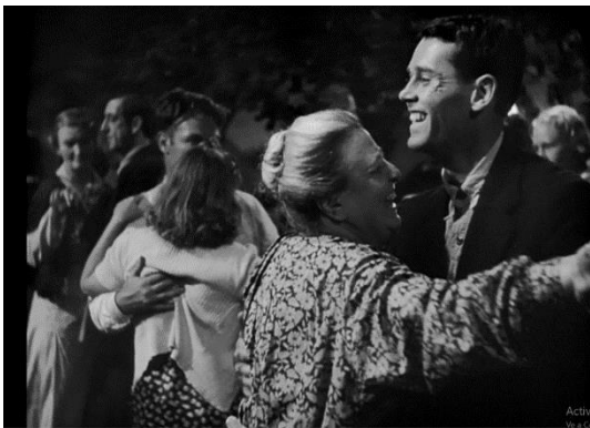
El baile del Sábado en el albergue de Bakersfield

El “ paradisiaco albergue para familias de trabajadores ” (si lo comparamos con resto de las experiencias vividas por los Joad en la película), no fue una ficción inventada por J. Steinbeck; existió en la realidad. Fue construido por la Administración de Seguridad Agrícola (FSA), dependiente del Gobierno Federal, al sur de Bakersfield, California, como parte de un amplio programa, iniciado hacia 1930 pero frustrado en su conjunto, que tenía por objeto albergar a