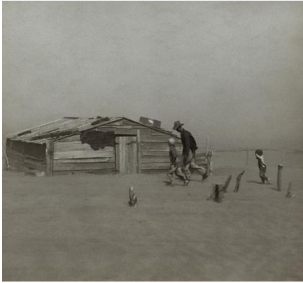
Tormenta de polvo en el Condado de Cimarron (Oklahoma 1936)

El efecto “Dust Bowl” fue provocado por condiciones persistentes de sequía, favorecidas por años de prácticas de manejo del suelo que dejaron al mismo susceptible a la acción de las fuerzas del viento. El suelo, despojado de humedad, era levantado por el viento en grandes nubes de polvo y arena tan espesas que escondían el sol. Estos fenómenos recibían la denominación de «ventiscas negras» o «viento negro».