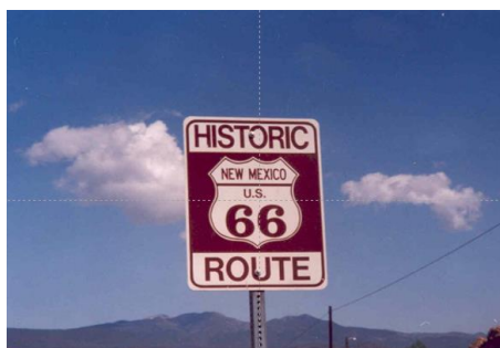
Señalización actual de un tramo conservado de la antigua US 66

La U.S. 66, también conocida como The Main Street of America ('La Calle Principal de Estados Unidos'), The Mother Road ('La Carretera Madre') y la ('Carretera de Will Rogers, formó parte de la Red de Carreteras Federales de Estados Unidos. Su puesta en servicio se produjo en el año 1926 aunque no se señaló hasta algún tiempo después.